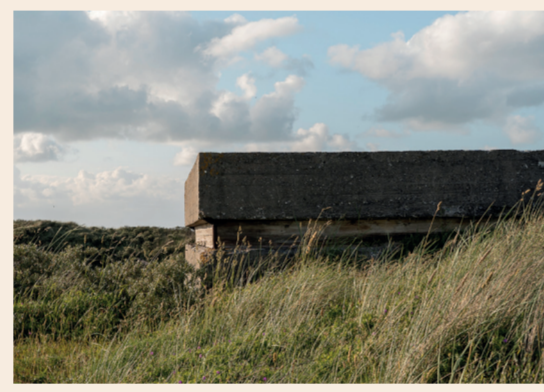
4: Ildlederbunker Del af "Marinestützpunkt Tversted", 1944.