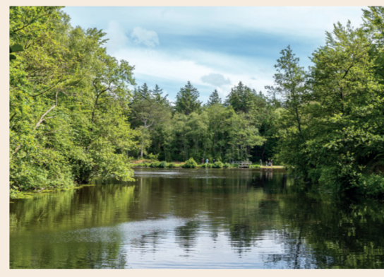
7: Tversted Søerne Samlingssted med naturlegeplads, grillplads m.m.