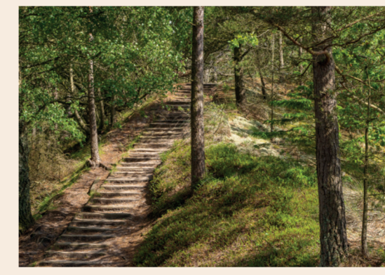
9: Ravklit Nyd en flot udsigt fra tårnet på Ravklit.