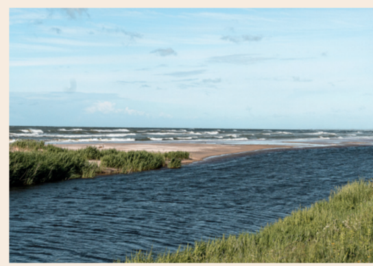
1: Uggerby Å Åen er 66 km fra Jyske Ås til Tannisbugt.