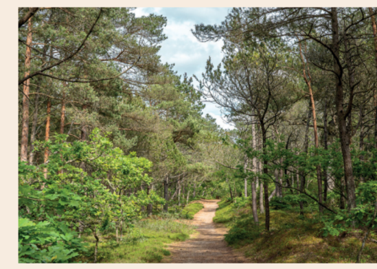
6: Tversted Klitplantage Den ældste klitplantage i Nordjylland.