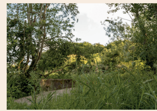
2: Det Gamle Teglværk Ved åen lå et teglværk fra 1890 til 1931.