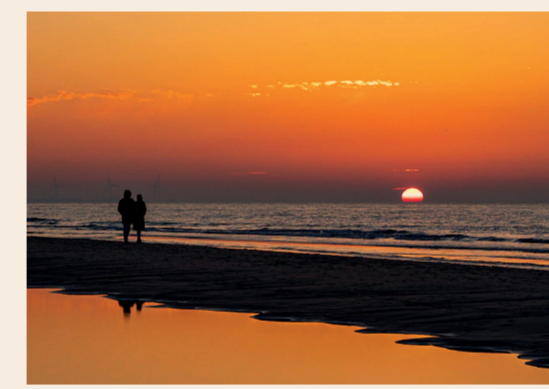
3: Tversted Strand Skøn badestrand. Nyd solnedgangen herfra.