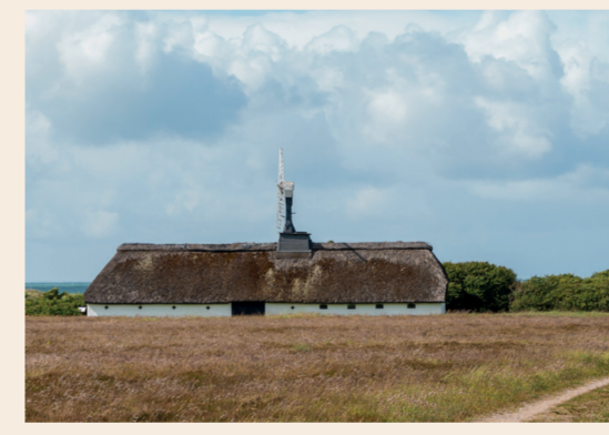
8: Østerklit Stokmølle Danmarks sidste fungerende stokmølle.